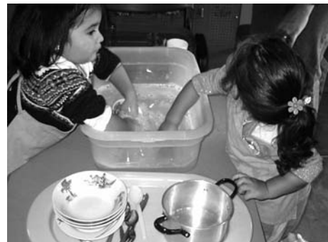
Actividad “Lavando la Loza”