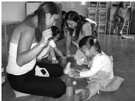
Actividad “Buscando el objeto escondido”

Es importante explicitar la intencionalidad pedagógica de la actividad y explicar las instrucciones tanto a los cuidadores como a los niños/as. El diseño de las actividades incorpora activamente al cuidador, con el propósito de dar herramientas concretas en estimulación, que puedan ser reforzadas posteriormente en el hogar.