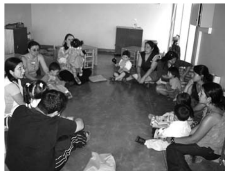
Círculo de cuento

En nuestra experiencia, durante los primeros meses de esta actividad resulta difícil captar la atención de los niños/as para que permanezcan tranquilos escuchando los cantos, cuentos y actividades sorpresa. A medida que desarrollan el hábito de escuchar y se familiarizan con esta actividad, es posible alargarla, haciéndola cada vez más compleja en términos de la concentración requerida y la participación que se espera de los niños/as.