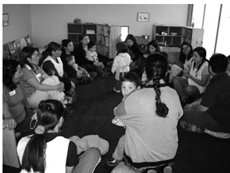
Círculo de cantos

Mediante cantos, rimas y cuenta cuentos se pretende avanzar en la estimulación del lenguaje.